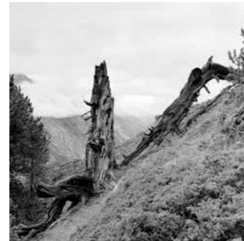
Encore debout – Riffelalp (VS)