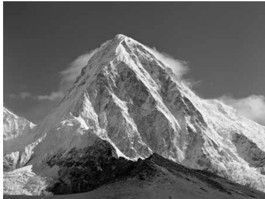
Pumori (7161 m), "Soeur de l'Everest" Himalaya - Gorak Shep