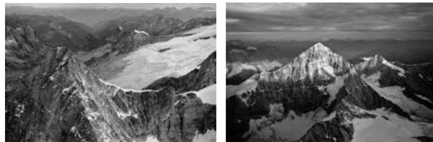
Le sommet de l'Obergabelhorn (4063 m), avec le Glacier du Moutet et le Blanc de Moming sur sa droite