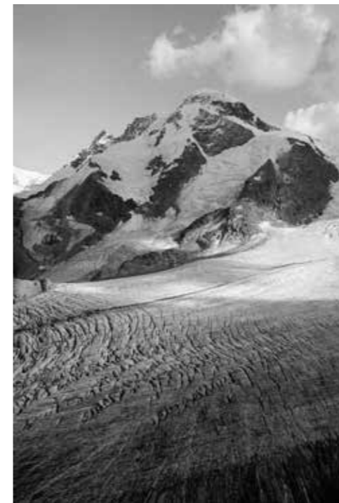
Breithorn, Refuge de Gandegg (VS)