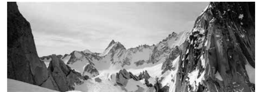
L'Aiguille de l'A Neuve, Glacier du Trient (VD)