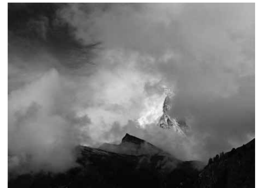
Déchirure – Zermatt (VS)