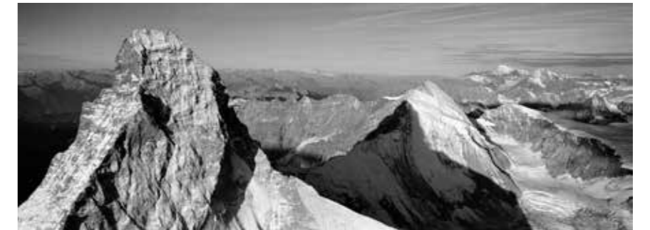
L'Ombre du matin